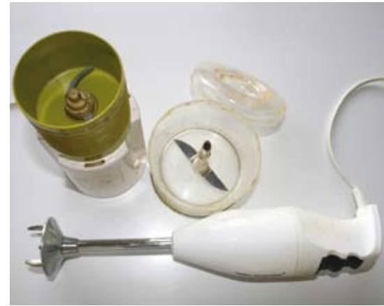
Oben links altes Modell von Moulinex (200 W), rechts daneben und unten „Zauberstab“ mit Zubehör „Zerkleinerer“.