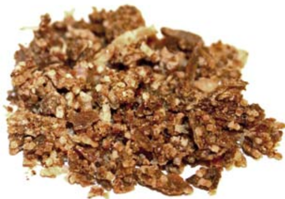
Rohpropolis: links gepresste Kugel, rechts fein gekörnte Propolis.

Das Ernten und Verarbeiten von Propolis ist relativ einfach. Für den Verkauf von Rohpropolis und Propolis-Produkten muss jedoch einiges beachtet werden.